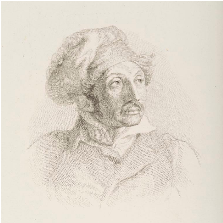
Portrait de Carl Haller von Hallerstein (1774-1817) paru dans The Temples of Jupiter Panhellenius at Ægina, and of Apollo Epicurius at Bassæ near Phigaleia in Arcadia de Robert Cockerell en 1860.