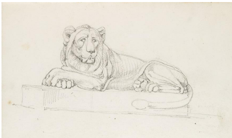
Karl Haller von Hallerstein, Termini Diocletiano , Carnet 1, folio 28 (détail), 27 juin 1809. Croquis à la mine de plomb.