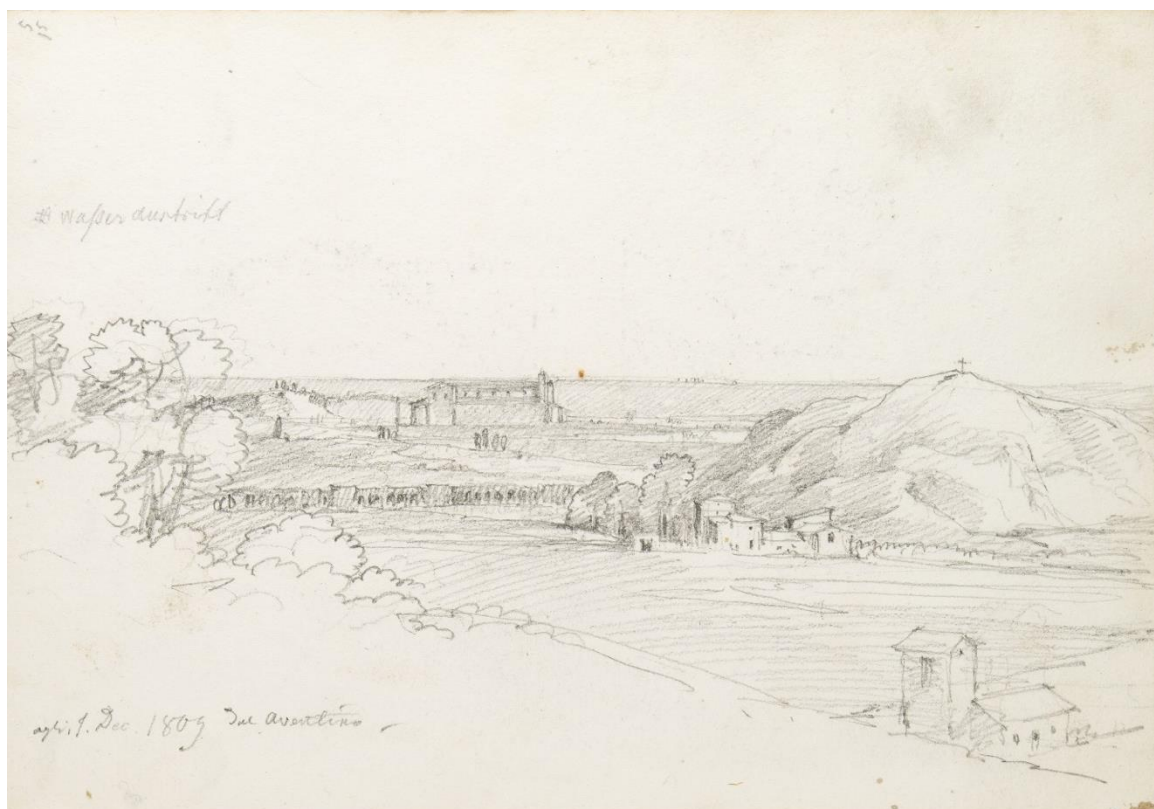
Karl Haller von Hallerstein, Vue depuis l'Aventin , Carnet 1, folio 15, 1809. Croquis à la mine de plomb.